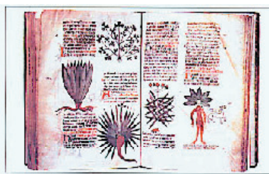
La MANDRAGORE mâle et femelle de la NIVE sicut

La Mandragore appartient à la famille des solanacées, il en existe deux espèces. Tout d'abord, la mandragore dite « mâle » ou Mandragora Officinarum , à racine blanche et à fleurs blanchâtres ou mauves que l'on trouve du nord de l'Italie à l'ouest de la péninsule des Balkans.