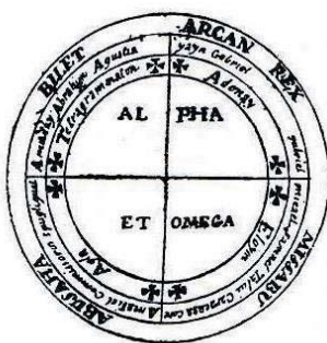
Fig. CX. — CERCLE DE VÉNUS.

Comme vous pouvez le constater grâce aux illustrations suivantes, ce n'est pas une petite affaire que de tracer un schéma pareil sur le sol. Dans « Traité Méthodique de Magie Pratique » de Papus, vous trouverez toutes les listes de correspondances nécessaires à ce type de magie invocatoire. D'ailleurs, voici la trame générale d'un Cercle magique ainsi qu'un exemple avec le Cercle magique de Vénus et celui de Mercure pour que tout le monde puisse avoir une idée précise de ce dont nous parlons.