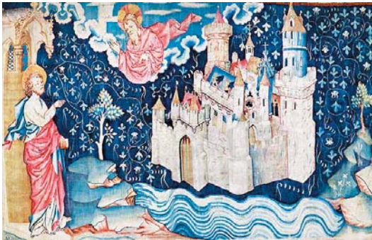
Le Jardin d'Eden

Le paradis céleste, pour les chrétiens l'aspiration au salut éternel, se concrétise dans la vision de la Jérusalem céleste par « ayant la clarté de Dieu » et « ne manquant ni de Soleil ni de Lune ».